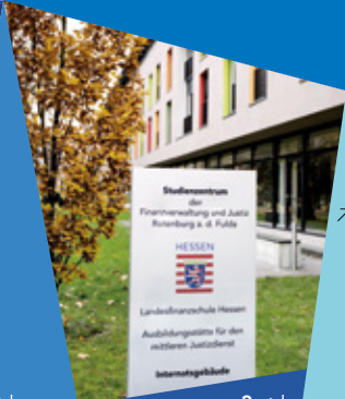
➔ Ausbildungsstätte Rotenburg